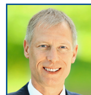
Frank Haberbosch Bürgermeister der Stadt Lübbecke