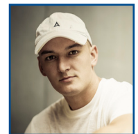
Montez Deutscher Profi-Rap- per u.a. 1. Deutscher Fairtrade Rap